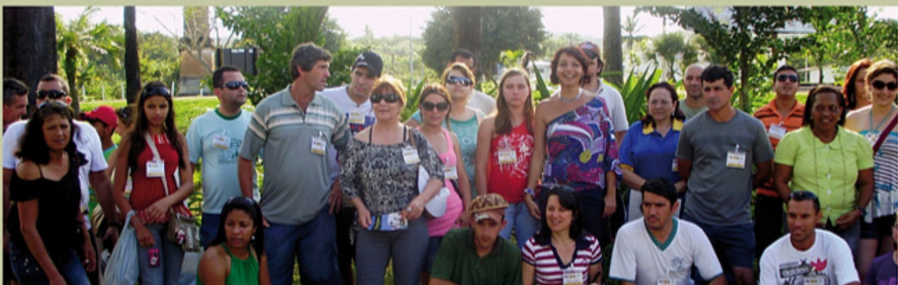
Integrantes de la Asociación Regional de las Casas Familiares Rurales del Sur de Brasil y de la Cooperativa Educacional de Santa Catarina en la Casa Familiar Agroforestal