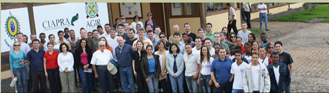
Participantes del Programa de Desarrollo de Empresarios (PDE) de Braskem con jóvenes del Bajo Sur