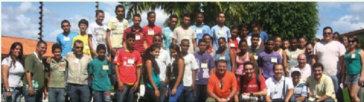
Miembros de la Asociación de los Restaurantes de Boa Lembrança y de la Revista Prazeres da Mesa con jóvenes del Bajo Sur