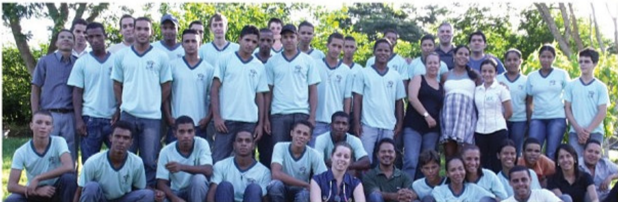
Agentes del Futuro del Consorcio Paraná conocen las iniciativas apoyadas por el Tributo al Futuro