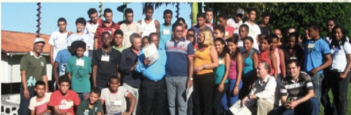
Intendentes de los municipios de Igrapiúna, Ituberá, Nilo Peçanha y de Pirai do Norte visitan las instituciones educativas del PDIS