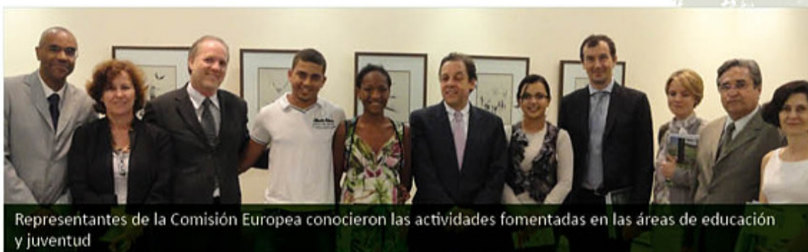
Representantes de la Comisión Europea conocieron las actividades fomentadas en las áreas de educación y juventud