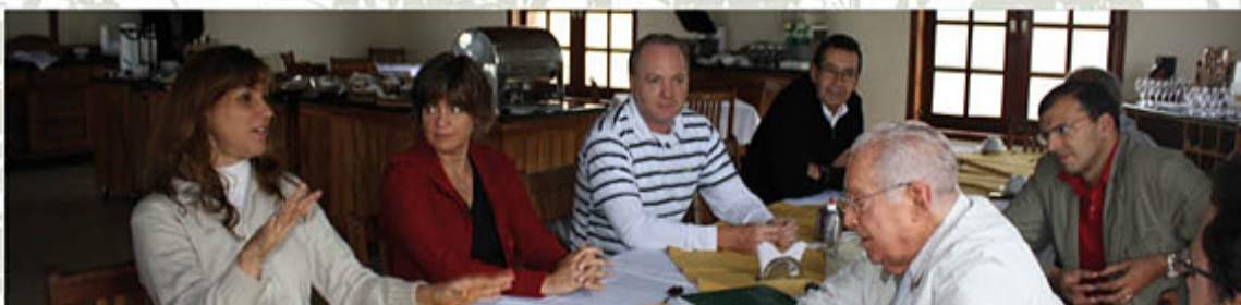
Representantes de Rainforest Alliance visitan la Sierra de Papuá – sede de la Asociación Guardiana del APA do Pratigi