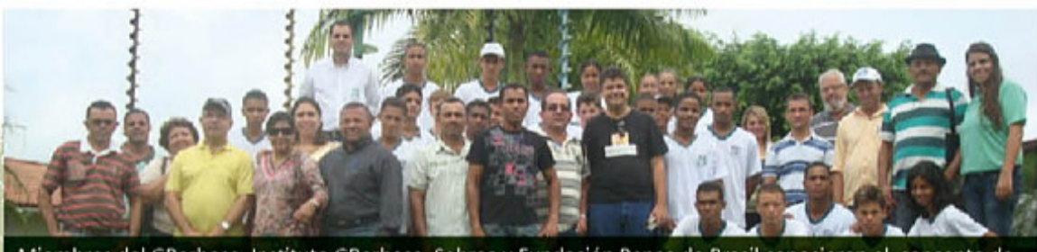
Miembros del GBarbosa, Instituto GBarbosa, Sebrae y Fundación Banco de Brasil conocieron el concepto de las Alianzas Cooperativas Estratégicas