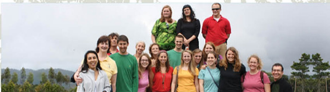
Profesores y alumnos de Sweet Briar College y St. Ambrose University, instituciones de enseñanza media y superior, respectivamente, de Virginia y Iowa, en Estados Unidos (EEUU)