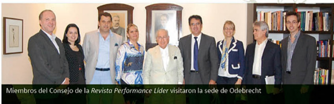
Miembros del Consejo de la Revista Performance Líder visitaron la sede de Odebrecht