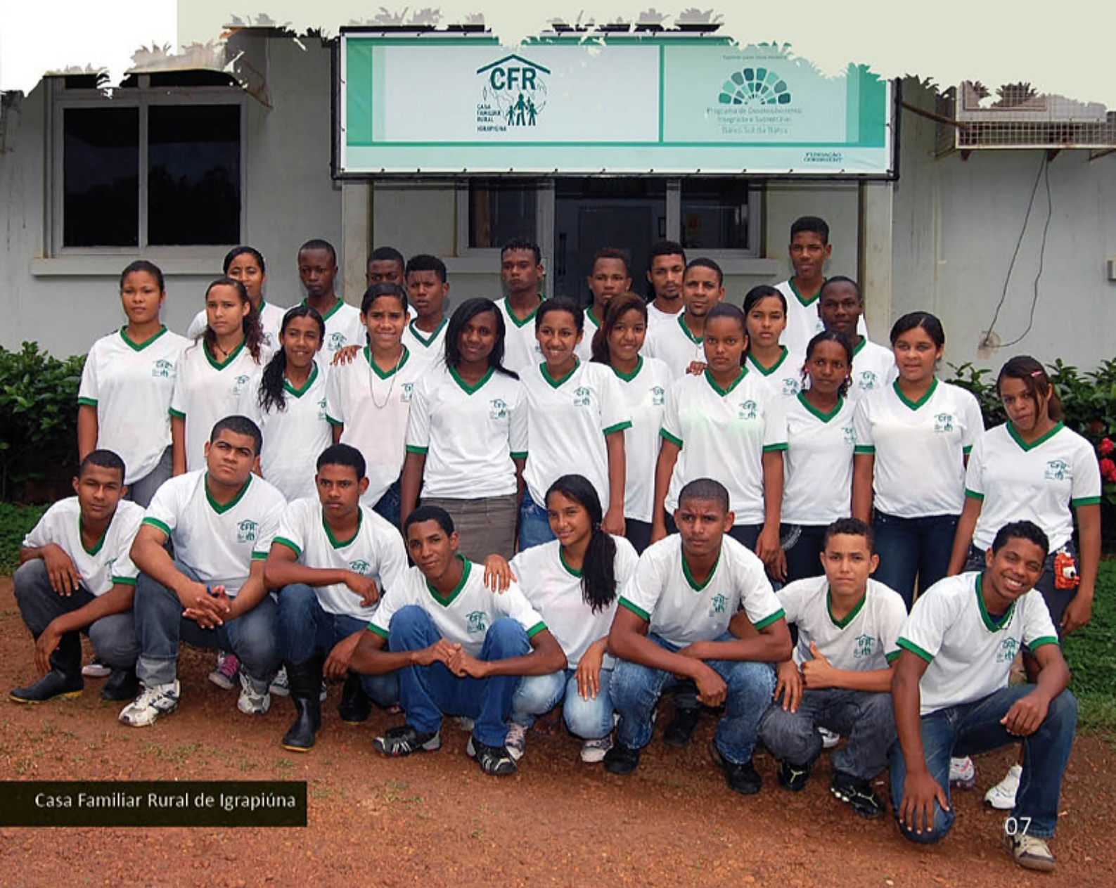
Casa Familiar Rural de Igrapiúna