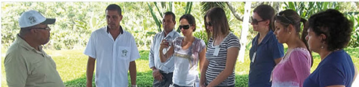
Representantes de Veracel Celulose y de Stora Enso pudieron observar de cerca el funcionamiento de la Alianza Cooperativa Estratégica de la Mandioca