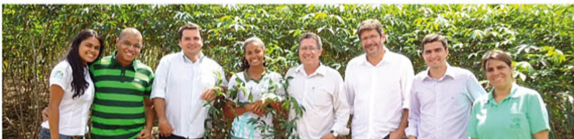
Integrantes de Foz do Brasil visitan el Campo Demostrativo de Tecnologías de la Mandioca