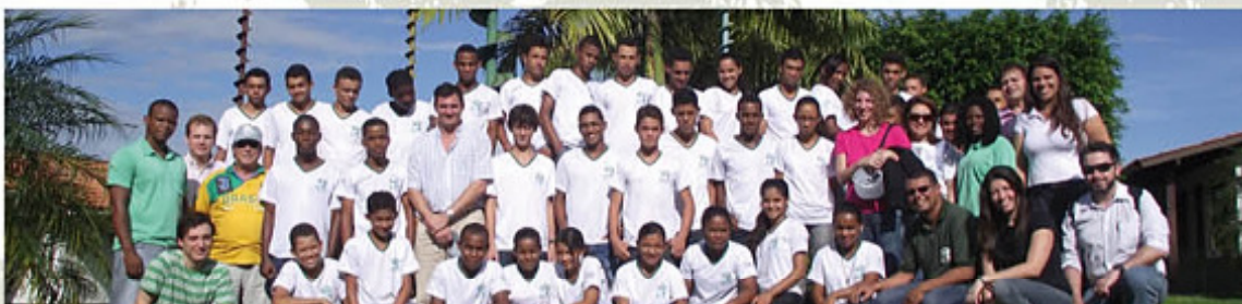
Periodista argentino y integrantes de Odebrecht Argentina visitaron actividades que fomentan los Capitales Humano, Social y Productivo