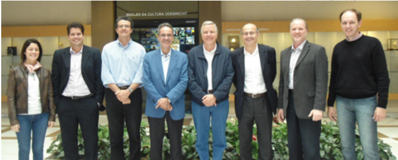
21 de mayo: representantes de la empresa Alstom estuvieron en el Edificio-Sede de Odebrecht, en Salvador (BA), para asistir a una presentación sobre el PDCIS