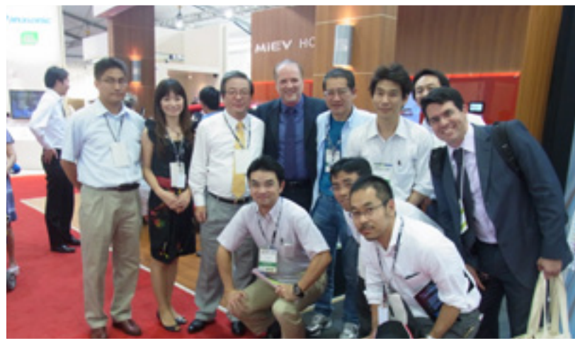
Representantes de la Mitsubishi Corporation y la Fundación Odebrecht en el stand que destacó PDCIS