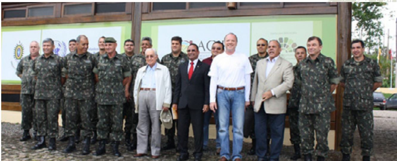
08 a 10 de mayo: 16 Oficiales del Ejército Brasileño observaron las actividades en ejecución en el Bajo Sur. El Comandante de la 6ª Región Militar, General Gonçalves Dias, acompañó parte de la agenda