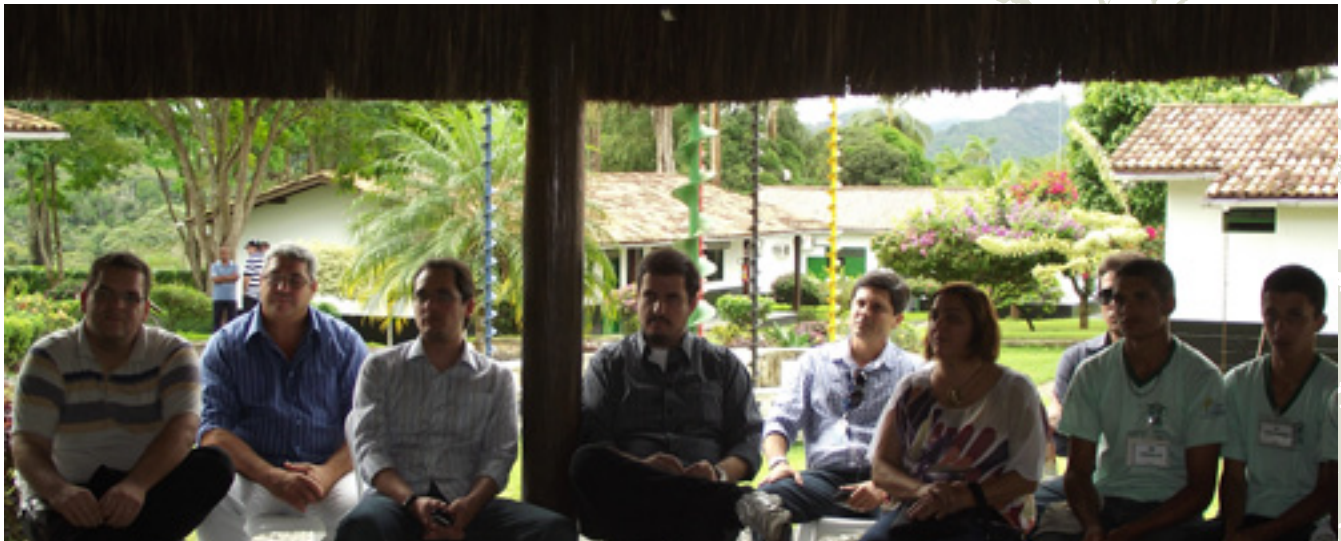
28 y 29 de mayo: el gerente de la Unidad de Desarrollo Territorial del Sebrae Nacional y el superintendente de Sebrae-Bahía, además de representantes de la sociedad civil y del Poder Público local, visitaron las sedes de las instituciones que integran las Alianzas Cooperativas Estratégicas del Almidón y la Mandioca