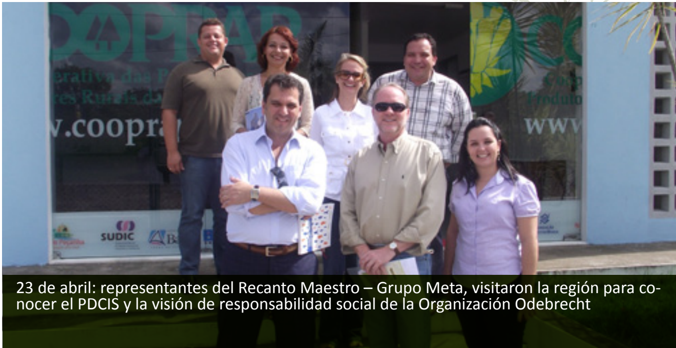
23 de abril: representantes del Recanto Maestro – Grupo Meta, visitaron la región para conocer el PDCIS y la visión de responsabilidad social de la Organización Odebrecht