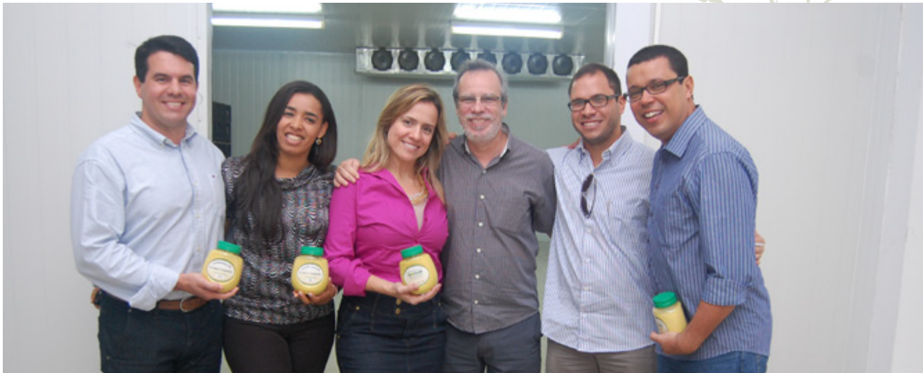
1º e 02 de Agosto: representantes del BNDES visitaron la Cooperativa de Productores Rurales de Presidente Tancredo Neves para participar en la inauguración de la Unidad de Pre-Beneficiamiento de Frutas, construida con el apoyo de la institución financiera