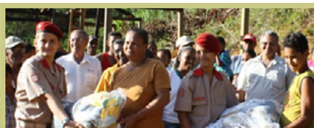
El Ejército distribuyó prendas de abrigo a cuatro asociaciones comunitarias del APA de Pratigi

Las 47 charlas realizadas hasta junio forman parte del cronograma de Acciones Cívico Sociales (Acisos) que culminarán a fin de año. Las Acisos se realizan en el Bajo Sur desde hace seis años, como resultado de una asociación con el Ejército, y desde 2009 cuentan con el apoyo de la Asociación Guardiana del APA de Pratigi (Agir).