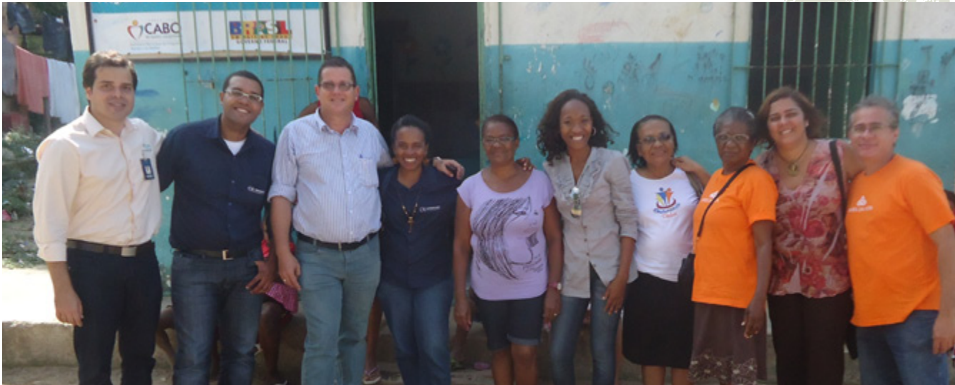
14 e 15 de Septiembre: representantes del Instituto de Desarrollo Sostenible del Bajo Sur de Bahía estuvieron en el barrio planificado Reserva do Paiva, un emprendimiento de Odebrecht Realizações Imobiliárias, en Recife (PE), para hacer intercambios