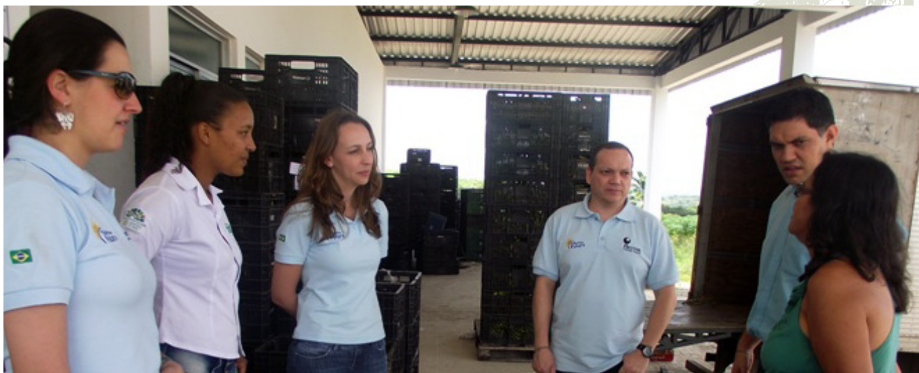
21 de Septiembre: integrantes de Mectron Engenharia, empresa que forma parte de Odebrecht Defesa e Tecnologia, visitaron las instituciones vinculadas a la Alianza Cooperativa de la Mandioca y Fruticultura