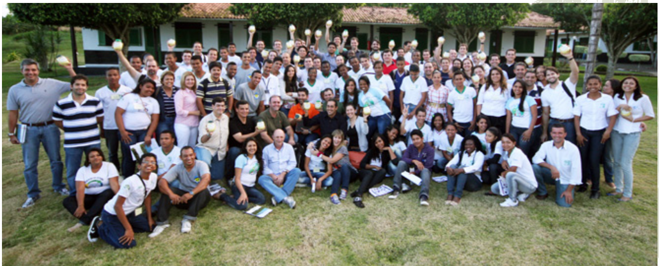
19 de Agosto: más de 60 personas interactuaron con jóvenes de las unidades de enseñanza vinculadas al PDCIS durante el tercer módulo de la 10ª edición del Programa de Desarrollo de Empresarios de Ingeniería, realizado en la Casa Familiar Rural de Presidente Tancredo Neves